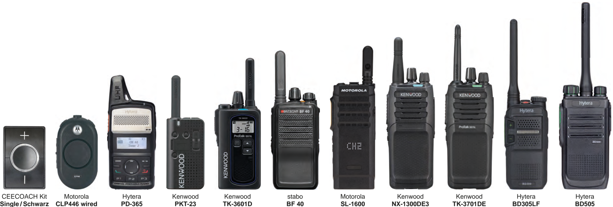
CEECOACH Kit Single/Schwarz